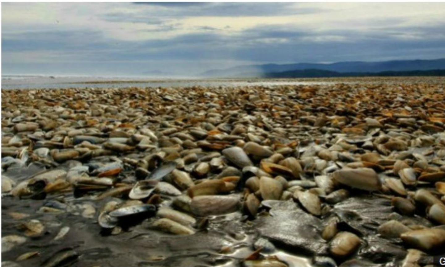
Los primeros brotes de la marea roja comenzaron en febrero.